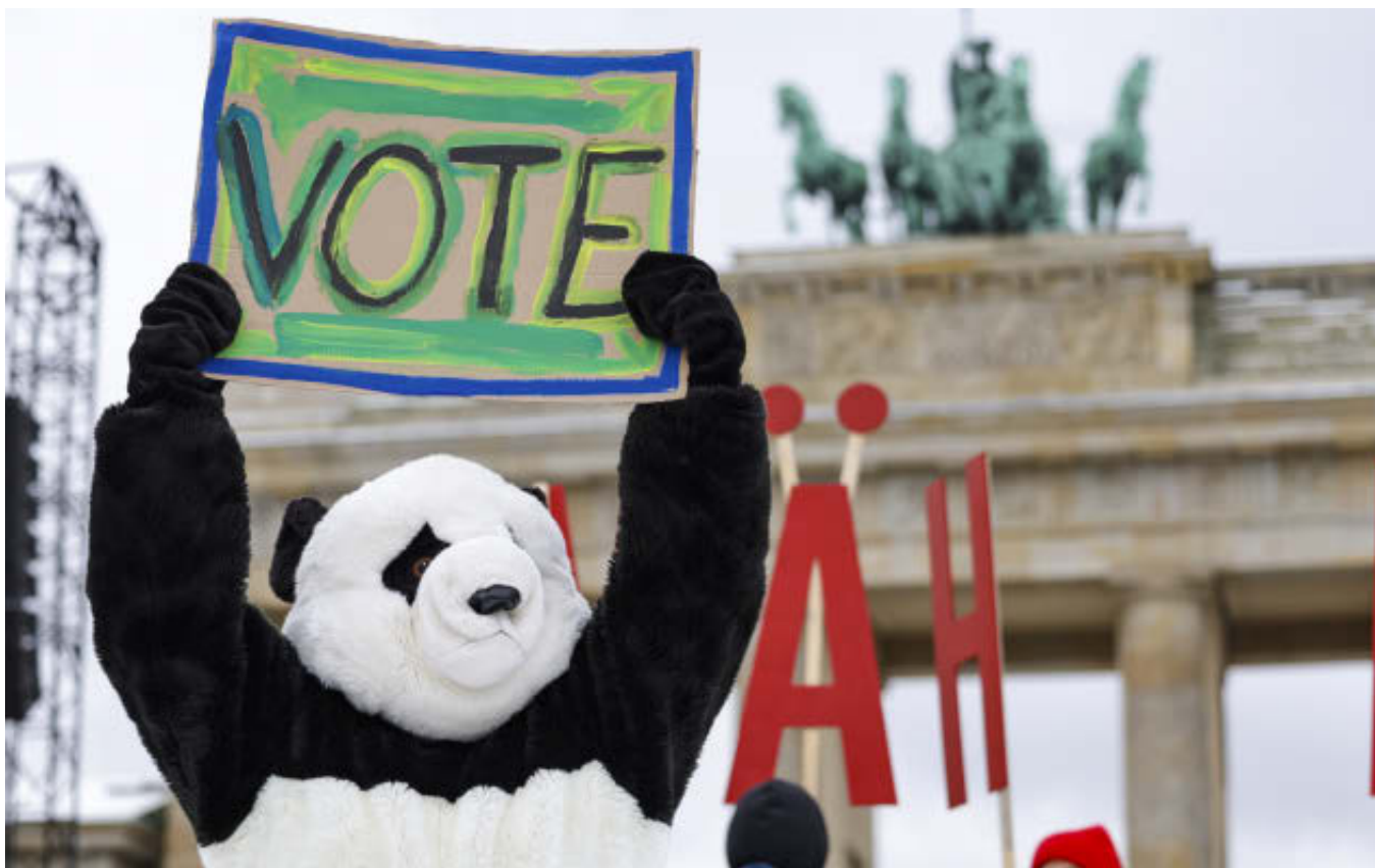
Okoljsko občutljivi Mladi hočejo izraziti svoje mnenje, vendar imajo pogosto vtis, da jih politiki ne poslušajo